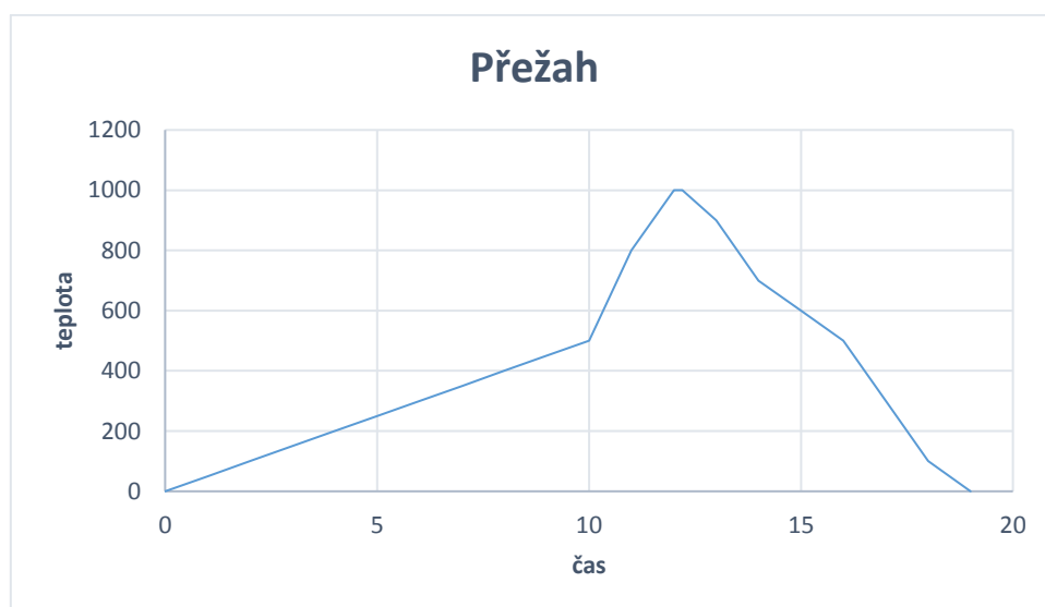
Tabulka 1: Přežah

Postup přípravy byl následující. Nejprve jsem si připravila velké kusy hlíny, které jsem následně sestavila na sebe do požadované výšky. Abych dosáhla základního tvaru mé představy použila jsem očko a strunu k odřezání přebytečné hlíny. Dále následoval krok, který vedl k tomu, že jsem musela celý výrobek rozřezat na menší části. A poté vydlabat za pomoci očka. Moje práce vedla dále k tomu, že jsem si vyválela silný plát, který sloužil jako podstavec pro moji sochu. Části, které jsem si předtím připravila na menší kusy jsem naškrábala a potřela šlikrem a začala je lepit na připravený plát. Když byla plastika opět v celku, doladily se poslední detaily a za pomoci špachtle a cidliny jsem svoji kočku dokončila k dokonalosti. Jako další se socha dala na přežah na 1000°C. Po vytažení z pece se plastika musela obrousit a začistit. Výrobek jsem štětcem natřela směsí mědi a železa. Poté jsem houbičkou dodělal kočce skvrny. Nakonec se plastika dala na ostrý vypal na 1200°C.