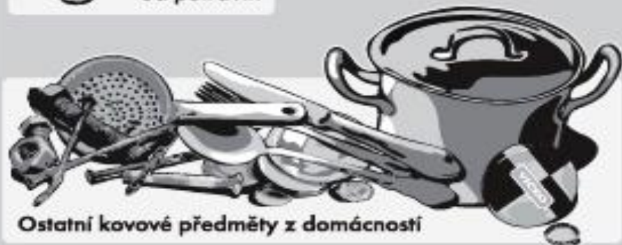
Ostatní kovové předměty z domácností

Nevhazujte obaly znečištěné zbytky potravin a nebezpečnými látkami!