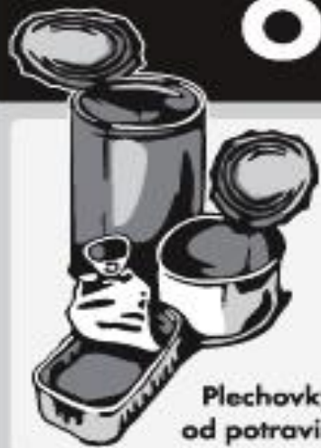
Plechovky od potravin